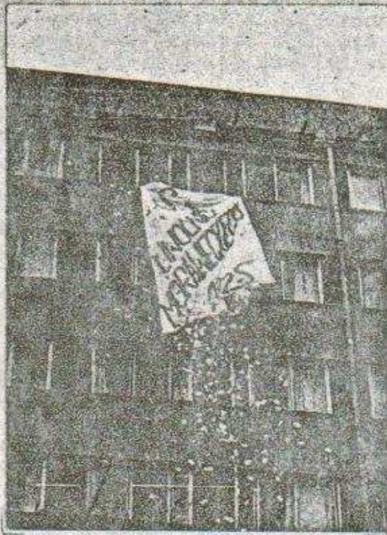
Plac Grunwaldzki 14-III-88 r. "Uwolnić Morawieckiego - NYS"

12.04.88. na placu przed wydziałem humanistycznym i matematyczno-fizycznym odbył się studencki happening, w którym uczestniczyło ok. 300 osób. Ukazały się flagi NYS-u, z okna wywieszono transparent, na którym obok rysunku dziada z worem widniał napis: "To nic, mamy za to socjalizm". Po aukcji ciuchów "Moda 2000" i dokarmianiu uczestników zabawy (w tym ubeków) burakami, zebrani - przy śpiewie międzynarodówki - dokonali samozagłady komunistycznej prasy w myśl hasła "Gdy z węglem są trudności - palmy »Żołnierza Wolności«".